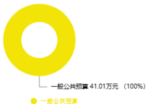
本年收入预算结构图

中国共产主义青年团通许县委员会2024年收入合计41.01万元，其中：一般公共预算41.01万元。