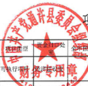
项目单位自评汇总表